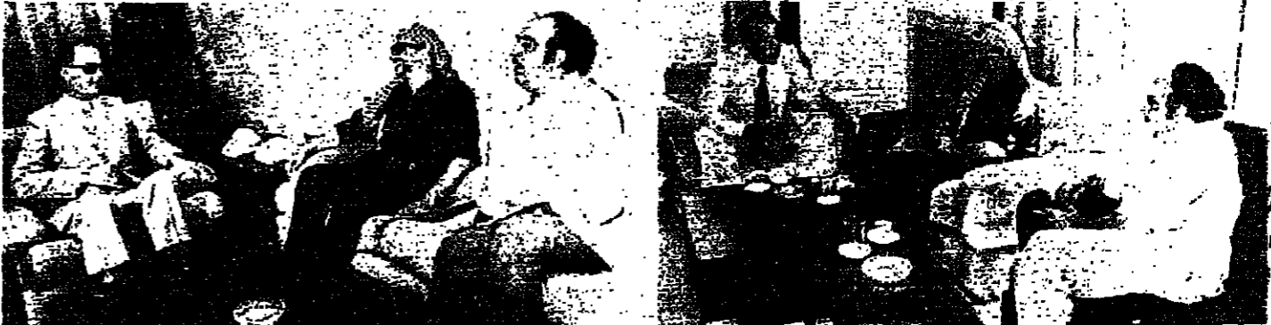
الرئيس الأسد يتحدث إلى أبو عمار وأبو أياد